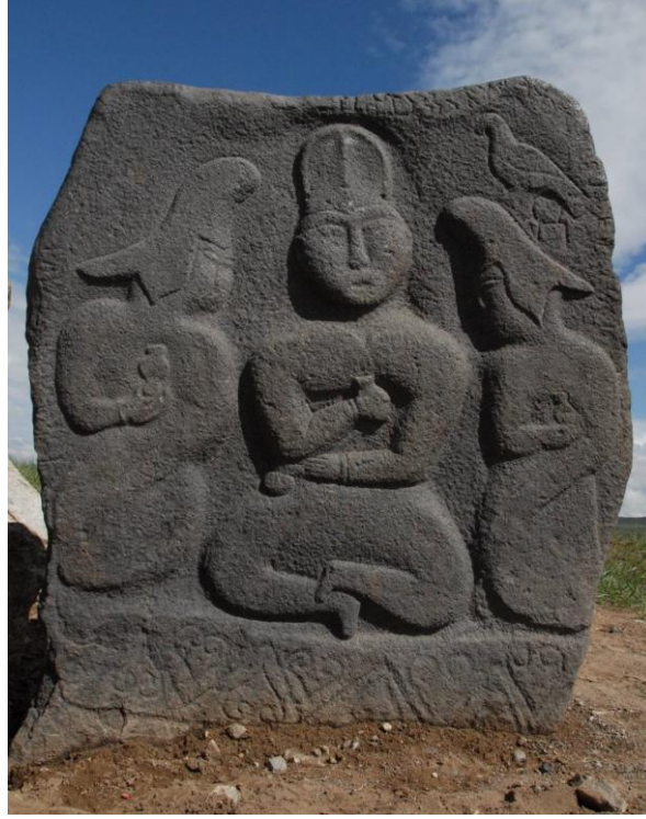
Foto 3: Sağ üst tarafında dağ keçisi / teke ile birlikte tasvir edilmiş kuş tasvirini barındıran Køl Tudun İnsi Altun Tamgan Tarkan Yazıtı'nın genel görüntüsü (Alyılmaz, 2016, s. 539)

Türk mitolojisinde göğün beşinci katında türeyen çift başlı kartal olduğuna inanılan bu kartal, göklerin büyük ve güçlü bir bekçisidir (Ögel, 1993, s. 109).