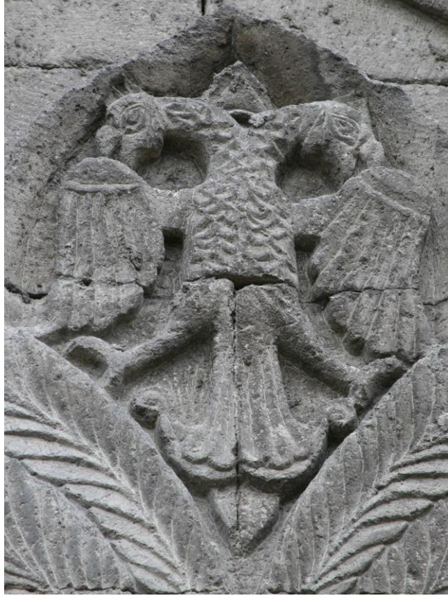
Foto 7: Hatuniye Medresesi'nin / Çifte Minareli Medrese'nin giriş kapısının sağındaki duvarda; üst tarafında çift başlı kartal tasviri bulunan bir süsleme (Alyılmaz, 2016, s. 528)