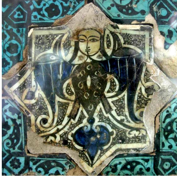
Foto 6: Kubadabad Sarayı'na ait diğer bir çini üzerindeki kartal gövdeli, insan başlı tasvirin görüntüsü (Alyılmaz, 2016, s. 524)

Dede Korkut Kitabı 'nda, asil ve erdemli kişiler alaca benekli kartala (çal-kara kuş) benzetilerek Oğuzların kartala duydukları saygı ve ona atfettikleri erdemlilik sıfatına vurgu yapılmıştır: