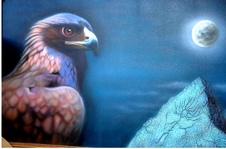
Foto 1: Gizemli dünyaların kuşu “kartal”ı betimleyen bir tablo (Alyılmaz, 2016, s. 513)

Türk boy ve topluluklarının yaşayış ve inançlarında da kartalın çok önemli bir yeri vardır. “Türkler tarafından ataların, dedelerin, bahadırların, kahramanların, bilgelerin ve kamların / şamanların ruhlarının göğe yükselip cisimleşmiş şekli ve Tanrı’nın habercisi olarak kabul edilen kartal (kara kuş / karakuş, bürküt / Bürkit, gök kuşu, güneş kuşu); gücün, kuvvetin, kudretin, yüceliğin, ululuğun, egemenliğin ve uzgörürlüğünün de sembolü olarak görülmüştür.” (Alyılmaz, 2016, s. 513)