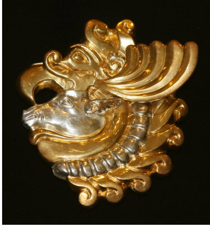
Foto 2: Hun Dönemi'ne ait; birçok hayvanın özelliklerini taşıyan (kartal gagalı) mitolojik varlığın altın üzerine işlenmiş görüntüsü (Alyılmaz, 2016, s. 516)

Kartal, Oğuz boylarının da ongunlarından biridir. Yirmi dört oğuz boyundan; Yazır, Döger, Dodurga ve Yaparlı boylarının ongunu kartaldır (Sümer, 1972, s. 210).