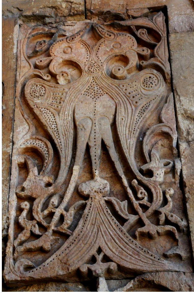
Foto 5: Divriği Ulu Cami ve Darüşşifası'nın dış cephesinde yer alan çift başlı kartal tasvirinin görüntüsü (Alyılmaz, 2016, s. 527)

Kartal; Azerbaycan, Kafkasya ve Anadolu'da halkın yaşayışında derin izler bırakmıştır.