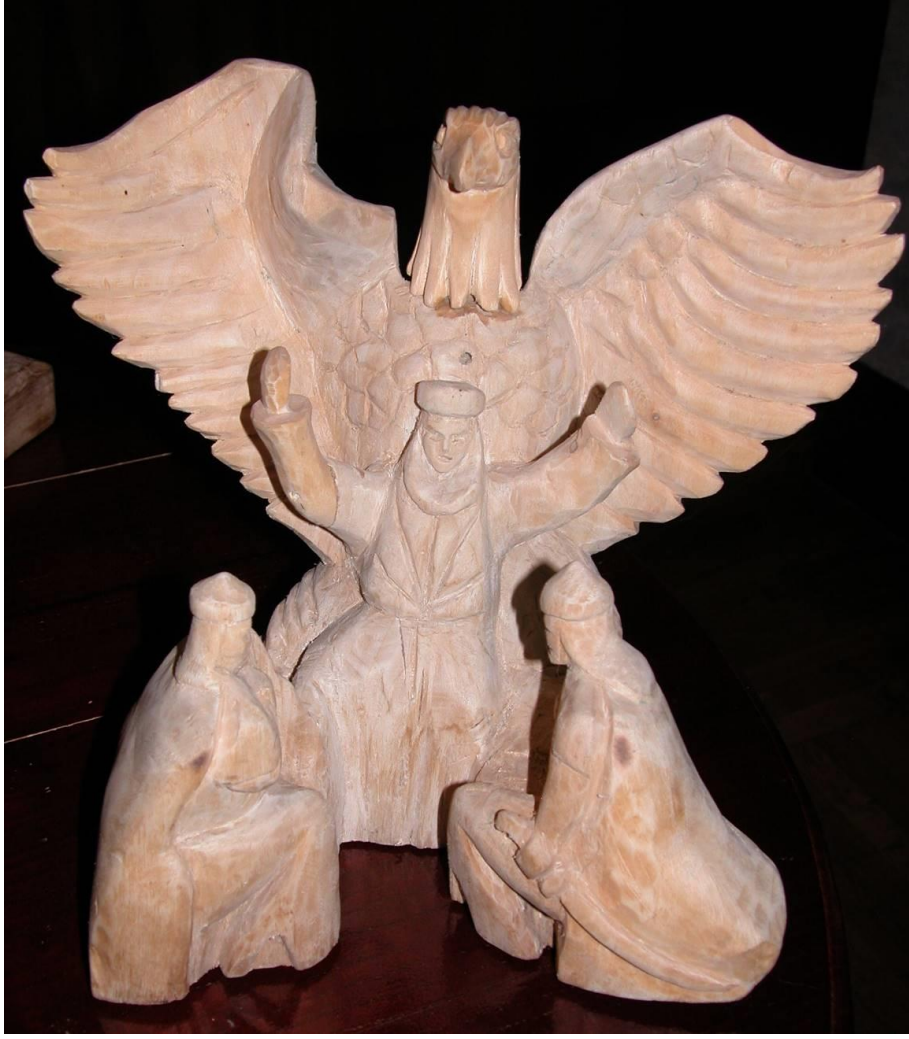
Foto 4: Kartalın taşıdığı gücü kağan ve katuna aktaran bibi / kadın kam (Alyılmaz, 2016, s. 519)

Anadolu Selçuklularında en çok kullanılan tek ve çift başlı kartal; kuvvet, kudret, asalet sembolü idi. İnsanı kötülüklerden koruduğuna inanılırdı (MEGEP, 2007, s. 3).